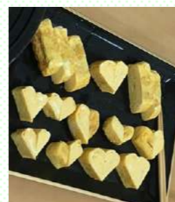
ハート型の卵焼き

メニューは「白飯・カレーライス・炊き込みご飯・玉子焼き・サラダ・熊本ラーメン・ミートパスタ・肉野菜炒め・豚しょうが焼き・から揚げ・アイスクリーム・メロンクリームソーダ・ソフトドリンク」でした。