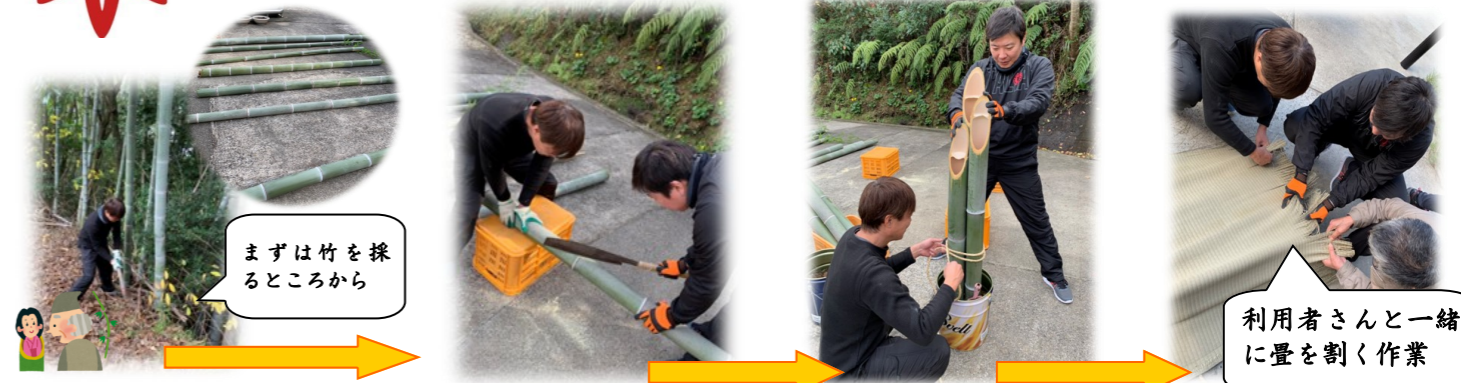
まずは竹を採るところから